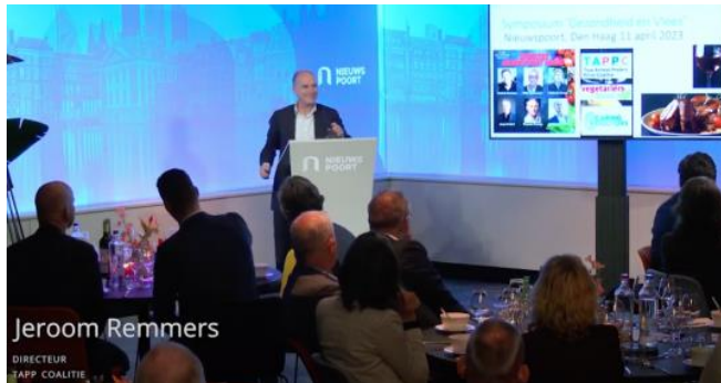
Figuur 9 Presentatie WUR-True Price rapport in Nieuwspoort

11/04/2023: Het onderzoeken van WUR naar de gezondheidseffecten van vlees werd gestart en gefinancierd op initiatief van TAPP en de Vegetariërsbond. TAPP en de Vegetarische Unie zaten hielen toezicht over de operatie. Het rapport "Consumer health: True pricing method for agri-food products" van WUR werd op 11 april 2023 overhandigd aan een vertegenwoordiger van het Ministerie van Landbouw en besproken met een aantal experts en parlementsleden tijdens een evenement in Nieuwspoort.