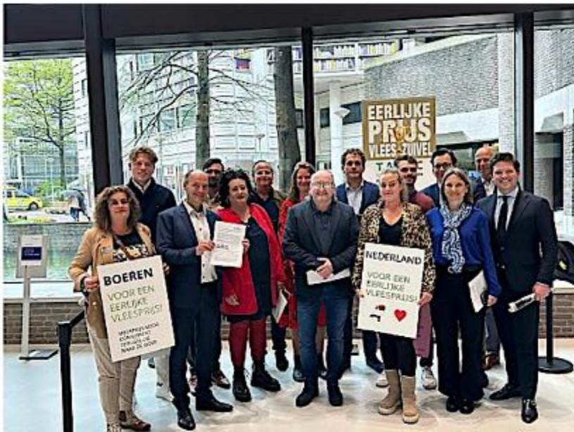
Figuur 1 09/05

09/05/2023: TAPP Coalitie bood samen met enkele partners drie rapporten aan aan de landbouwexperts van de Tweede Kamer om bij de dragen aan beleidsontwikkelingen. Acht Kamerleden waren aanwezig.