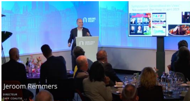
Figuur 9 Presentatie WUR-True Price rapport in Nieuwspoort

11/04/2023: Het onderzoeken van WUR naar de gezondheidseffecten van vlees werd gestart en gefinancierd op initiatief van TAPP en de Vegetariërsbond. TAPP en de Vegetarische Unie zaten hielen toezicht over de operatie. Het rapport "Consumer health: True pricing method for agri-food products" van WUR werd op 11 april 2023 overhandigd aan een vertegenwoordiger van het Ministerie van Landbouw en besproken met een aantal experts en parlementsleden tijdens een evenement in Nieuwspoort.