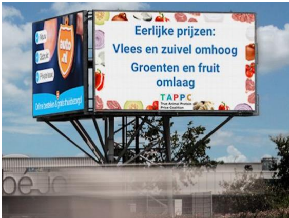
Figuur 3 Snelwegreclame TAPP Coalitie

14/11/2023: TAPP Coalitie heeft een eigen Stemwijzer gepubliceerd op de website. Daarnaast heeft TAPP Coalitie in samenwerking met OPRG in combinatie met de stemwijzer een snelweg-reclamecampagne gelanceerd op zes verschillende locaties in Nederland.