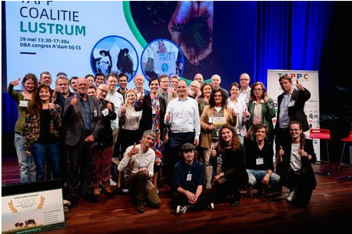
Foto: aanwezige partners en bestuursleden TAPP Coalitie op Lustrum congres 29 mei